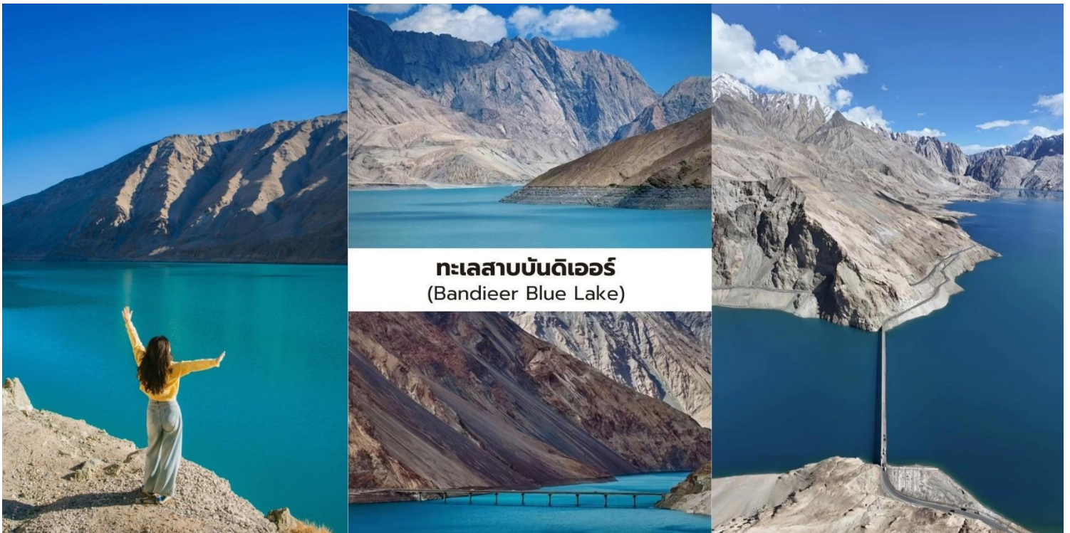
ทะเลสาบบันด์ิเออร์ (Bandieer Blue Lake)

นำท่านเที่ยวชม ทะเลสาบบันด์ิเออร์ (Bandieer Blue Lake) ทะเลสาบสีฟ้าใสที่ตั้งอยู่บน ที่ราบสูงปามีร์ เกิดจากน้ำละลายของธารน้ำแข็งโบราณทำให้พื้นน้ำมีสีฟ้าครามเข้มตัดกับภูเขาหินสีน้ำตาลที่โอบล้อมอยู่โดยรอบ เกิดเป็นทัศนียภาพที่งดงามและแปลกตา พื้นน้ำของทะเลสาบสามารถเปลี่ยนเฉดสีตามแสงและสภาพอากาศบางช่วงจะปรากฏเป็น สีเขียวมรกต และบางช่วงเป็น สีน้ำเงินครามลึก สะท้อนเงาของภูเขาและท้องฟ้าอย่างสวยงามทำให้ทะเลสาบแห่งนี้ถูกขนานนามว่าเป็น “อัญมณีแห่งที่ราบสูงปามีร์” บริเวณโดยรอบยังคงความเงียบสงบและธรรมชาติที่บริสุทธิ์เหมาะสำหรับการชมวิวและถ่ายภาพถือเป็นหนึ่งใน จุดชมวิวธรรมชาติที่สวยงาม และยังไม่เป็นที่รู้จักมากนัก ของซินเจียง ซึ่งนักท่องเที่ยวทั่วไปยังเดินทางมาไม่ถึงมากนัก