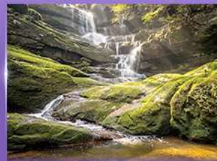
น้ำตกสายทิพย์