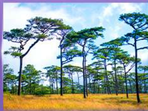
ลานสนกุสอยดาว