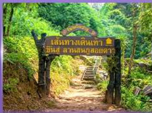
พีช 5 เป็นวัดใจ