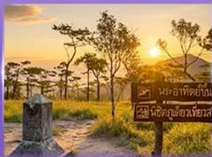
ชมพระอาทิตย์ขึ้น กุสอยดาว