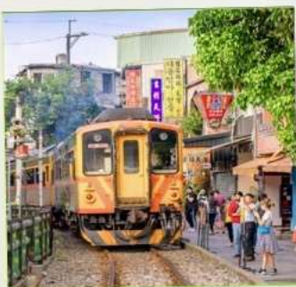
สถานีรถไฟซือเฟิ่น