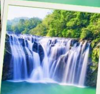
น้ำตกซือเฟิ่น