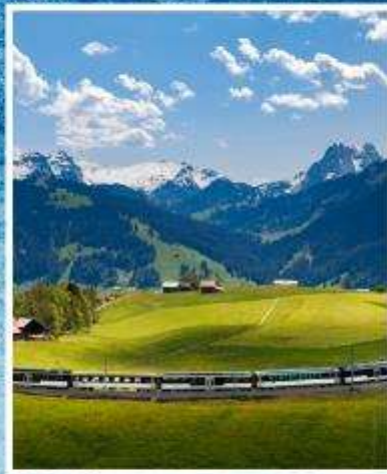
GOLDEN PASS LINE Montreux-Zweisimmen