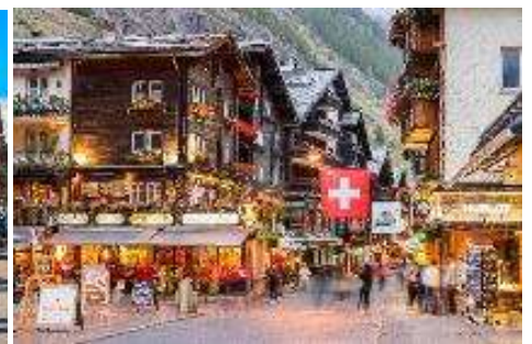
เที่ยง บริการอาหารกลางวัน ณ ภัตตาคาร