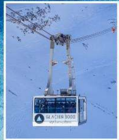
GLACIER3000 Peak walk by Tissot