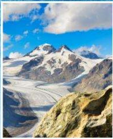
ALETCH GLACIER Riederalp, Bettmeralp

แกรนด์สวิตเซอร์แลนด์ 9 วัน พักหมู่บ้านเชอร์แมท