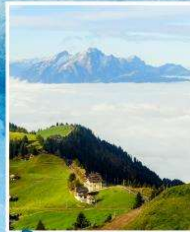
RIGI KULM Queen of the Mountains