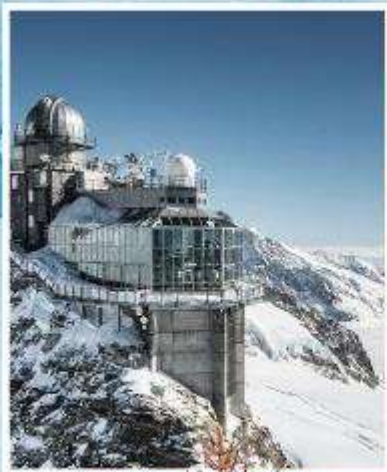
JUNGFRAUJOCH "Top of Europe"