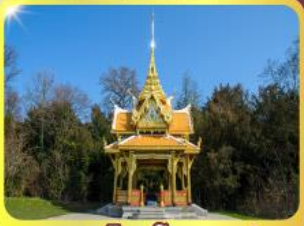
ศาลาไทยไชยานท์

GO3CDG-TG058 • ชมมหาวิหารแห่งเมืองมิลาน 8 วัน | 5 คืน