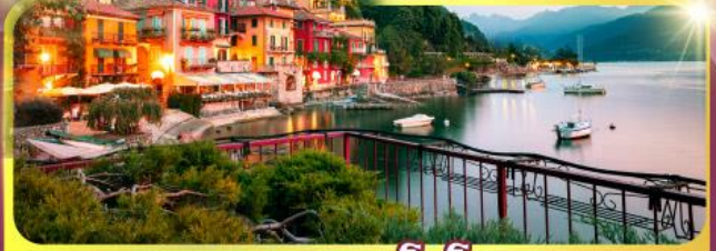
ทะเลสาบโลโบ

11-18 มิ.ย. 69 / 25 มิ.ย. - 02 ก.ค.69 02 - 09, 16-23 ก.ย.69 / 07 -14, 22-29 ต.ค.69 เดินทาง : 04 - 11, 11-18 พ.ย.69 25 พ.ย. - 02 ธ.ค.69 03 - 10, 23-30 ธ.ค.69 / 23 - 30 ธ.ค. 69 29 ธ.ค.69 - 05 ม.ค.70