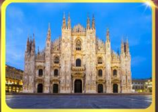
มหาวิหารแห่งเมืองมิลาน