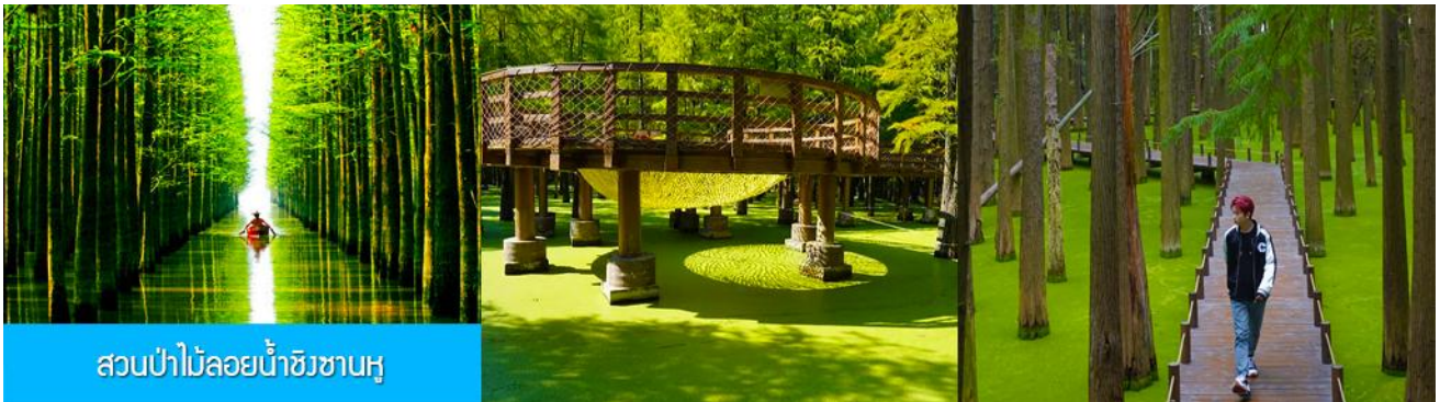
สวนป่าไม้ลอยน้ำชิงชานหู

หลังอาหารเช้าท่านเดินทางโดยรถบัสสู่เมืองหลิงอัน 临安市 (ระยะทาง 175 กม. ใช้เวลาเดินทางราว 2 ชั่วโมงเศษ)