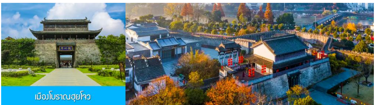
เมืองโบราณฮุยโจว

หลังอาหารนำท่านเที่ยวชม เมืองโบราณฮุยโจว 徽州古城 แหล่งท่องเที่ยวระดับ 5A และเป็นหนึ่งในสี่เมืองโบราณที่คงสภาพสมบูรณ์และมีขนาดใหญ่ที่สุดของจีน ตั้งอยู่ในอำเภอเซอเจี๋ยน มณฑลอันฮุย เมืองโบราณ