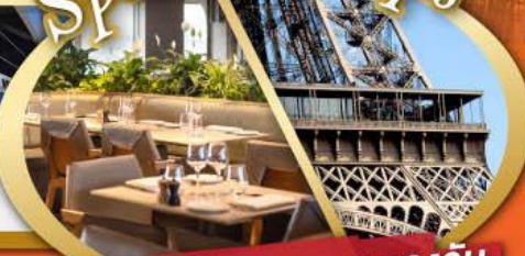
รับประทานอาหารกลางวัน บนหอคอยเฟลา

ไฮไลท์ในโปรแกรม • สะพานไมซ์าเปล ลูเซิร์น