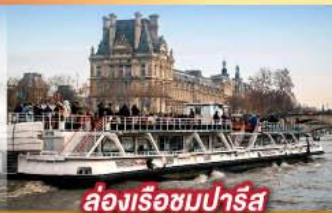
ล่องเรือชมปารีส