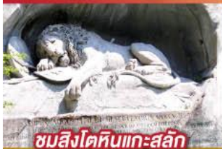
ชมสิงโตหินแกะสลัก