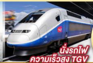
นั่งรถไฟ ความเร็วสูง TGV