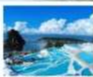
ซานโตรินี่ด้าหลี่