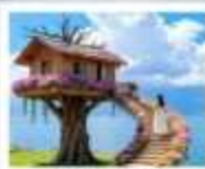
หมู่บ้านเหวินบี