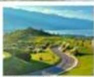
กุช่าววันเซียงซาน