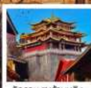
วัดสามะชงจันหลิง