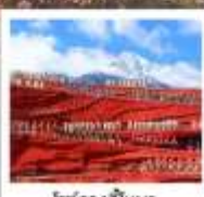
ไร่ชาฉือหนิว

เมืองโบราณต้าหลี่ / เจดีย์สามองค์ / ไค้งริ / ภูเขาสานอ้อไห่ / เมืองโบราณแซงกรีล่า / ช่องแคบเสือกะโถด (รวมบินไปเคื่องฉั้น-กง) / วัดสามะชงจันหลิง (รวมท่ารถขึ้น-ลง) ชมวิวยามค่ำกินเมืองโบราณลี้เจียง / ภูเขาหิมะมังกรหยก (มังกรง้อไห่ใหญ่) / ภูเขาพระจันทร์สีน้ำเงิน ไร่ชาฉือหนิว (รวมรถออสัฟ) / ไร่ชาฉือหนิว / เมืองโบราณไปซา มังกรไฟชมวิวย้อนภูเขาหิมะมังกรหยก / สระมังกรดำ / คาเฟ่ไวน์ดีอัน YUN DI AN CAFE (รวมค่าเครื่องดื่ม) / เมืองโบราณลี้เจียง / ถนนคนเดินจินนี่ตู้