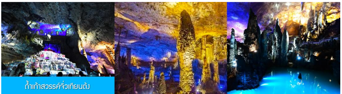
ถ้ำเก้าสวรรค์จิวเทียนตั่ว

พักที่ HANTING HOTEL ระดับ 4 ดาวท้องถิ่นหรือเทียบเท่าในเมืองจางเจียเจี๋ย