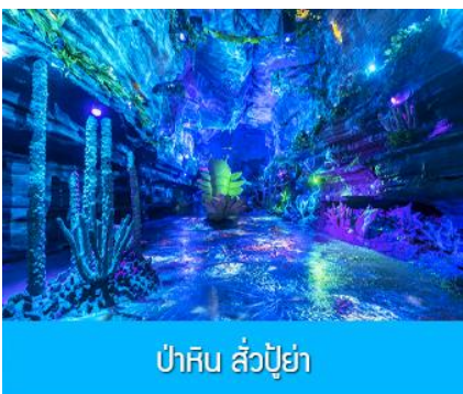
ป่าหิน ลั่วปู้ย่า

รับประทานอาหารเช้า ณ ห้องอาหารของโรงแรม (10)