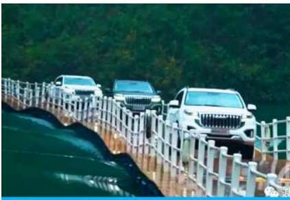
นั่งรถผ่านชมถนนลอยน้ำด่านสิงโต