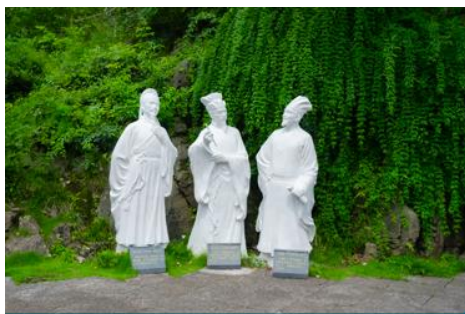
สวนเก้าสามสหาย