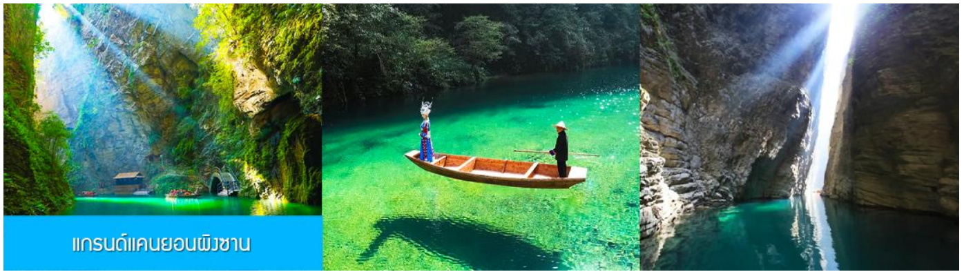
แกรนด์แคนยอนผิงซาน