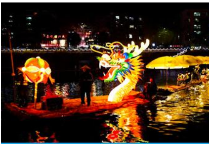
นั่งเรือมังกรเที่ยวชมความงาม