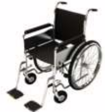
การรับการดูแลเป็นพิเศษ

กรณีผู้เดินทางต้องการความช่วยเหลือเป็นพิเศษ อาทิเช่น การใช้วีลแชร์ กรุณาแจ้งบริษัทฯ อย่างน้อย 7 วันก่อนการเดินทาง มิฉะนั้นบริษัทฯ จะไม่สามารถจัดการล่วงหน้าได้ เนื่องจากการขอใช้วีลแชร์ในสนามบินนั้น ต้องมีขั้นตอนในการขอล่วงหน้า และบางสายการบินอาจมีการเรียกเก็บค่าใช้จ่ายทั้งทางสนามบินในไทยและในต่างประเทศ ซึ่งผู้เดินทางสามารถสอบถามกับเจ้าหน้าที่ได้โดยตรงก่อนทำการจอง และหากในขณะของท่านมีผู้ต้องการดูแลพิเศษ เช่น ผู้ที่นั่งรถเข็น (Wheelchair), เด็ก, ผู้สูงอายุและผู้ที่มีโรคประจำตัวหรือไม่สะดวกในการเดินทางท่องเที่ยวในระยะเวลาเกินกว่า 4 - 5 ชั่วโมงติดต่อกัน ท่านและครอบครัวต้องให้การดูแลสมาชิกภายในครอบครัวของท่านเอง เนื่องจากการเดินทางเป็นหมู่คณะ หัวหน้าทัวร์มีความจำเป็นต้องดูแลคณะทัวร์ทั้งหมด