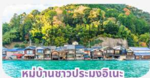
หมู่บ้านชาวประมงอิเนะ