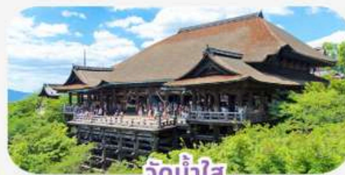
วัดน้ำใส