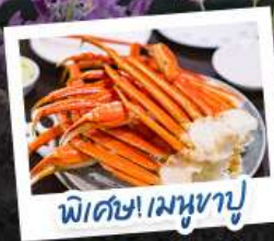
พิเศษ! เมฆาบู