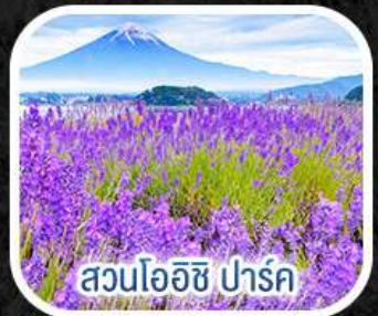
สวนโออิชิ ปาร์ค