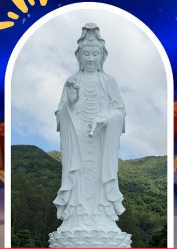
วัดซีซัน