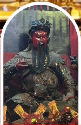
วัดกวนโถ

ขอเทพเจ้ากวนอู ความซื่อสัตย์ เงินทอง ธุรกิจมั่นคง