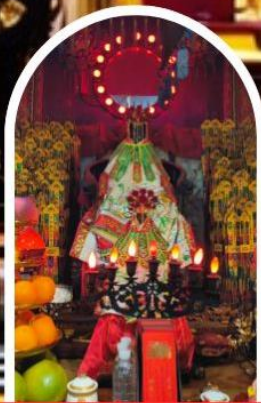
วัดเจ้าแม่กวนอิมฮ่องฮำ

เสริมโชคกลางนำความรุ่งเรืองทุกด้านของชีวิต