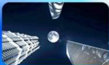
ลูจ็ยสุย