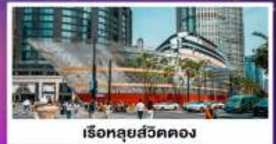
เรือทลุยสวีตคอง