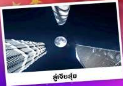
ดูเจ็ทสูย