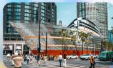
เร็องหลุยส์วิตคอง