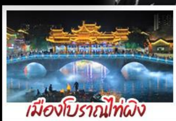
เมืองโบราณไท่ผิง