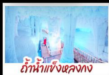
ถ้ำน้ำแข็งหลงก

น้ำตกต๋อเทียน - กุ้ยหยางชมลาเวนเดอร์ - ชีเจียงหมู่บ้านแม่ชีพันหลังคา ถ้ำน้ำแข็งหลงก - เมืองโบราณไท่ผิง - รถไฟความเร็วสูง เบนูพิเศษ บุฟเฟ่ต์อย่างบาร์บีคิว - อาหารเวียดนาม - อาหารกวางตุ้ง