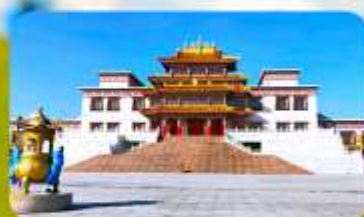
คฤหาสน์พุทธบูชาแห่งชีวิคยูลาน