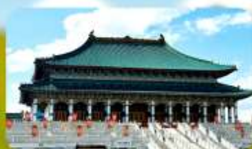
พระราชวังต้องห้ามออร์ดอส