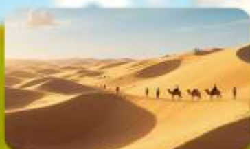
เนินทรายอินเคินทาลา