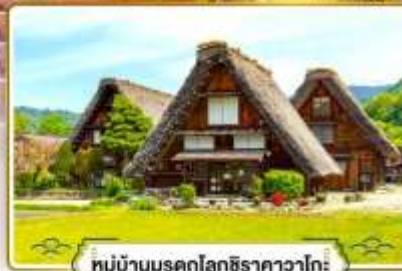
หมู่บ้านมรดกโลกชิราคาวาโกะ

✓ ช้อปบิงย่านฮิตที่สุดในโอซาก้า "ชินโซบาชิ"