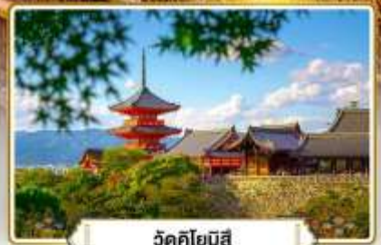
วัดคิโยมิตสึ