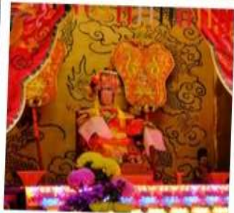
เจ้าแม่ทับทิม จอสเฮาส์เบย์