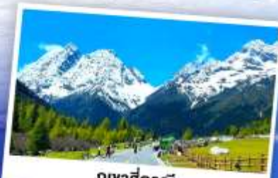
ภูเขาสี่ครุณี