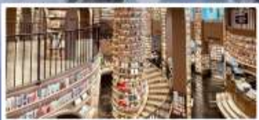
ร้านหนังสือจงซูเก้อ