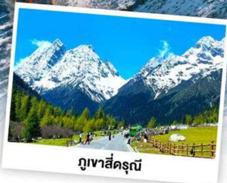
กุเวาสีครุณี

เดินทางโดย: สายการบินเจียงตูแอร์ไลน์ (EU)