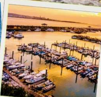
ท่าเรือประมงตั้นสุ่ย