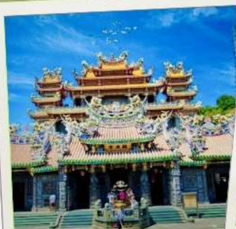
วัดกวนตุ๋