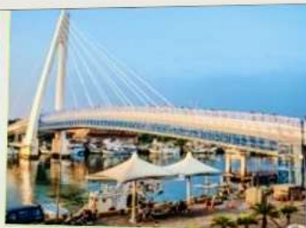
สะพานคู่รักตั้นสุ่ย