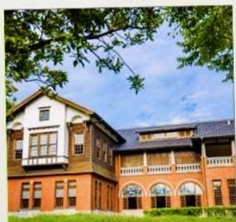
พิพิธภัณฑน์น้ำพุร้อนเป่ย์โถว