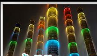
น้ำพุไม้ไผ่ตึกSKP