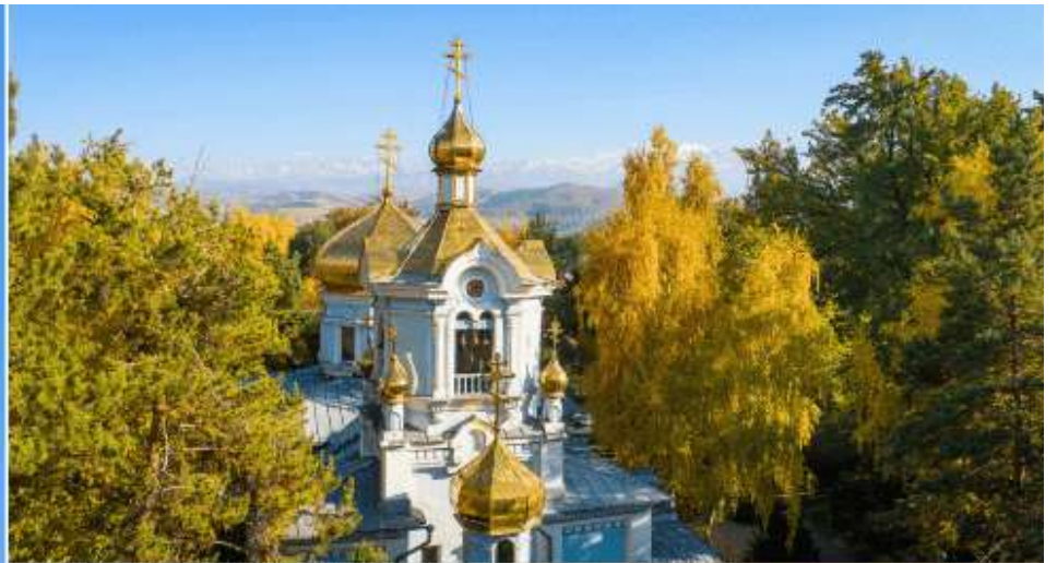
KAZAN ICON OF THE MOTHER OF GOD CATHEDRAL