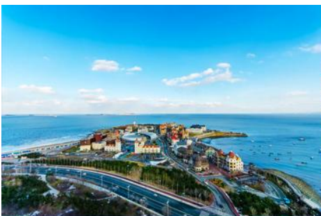
ท่าเรือชาวประมงไห่ซาง