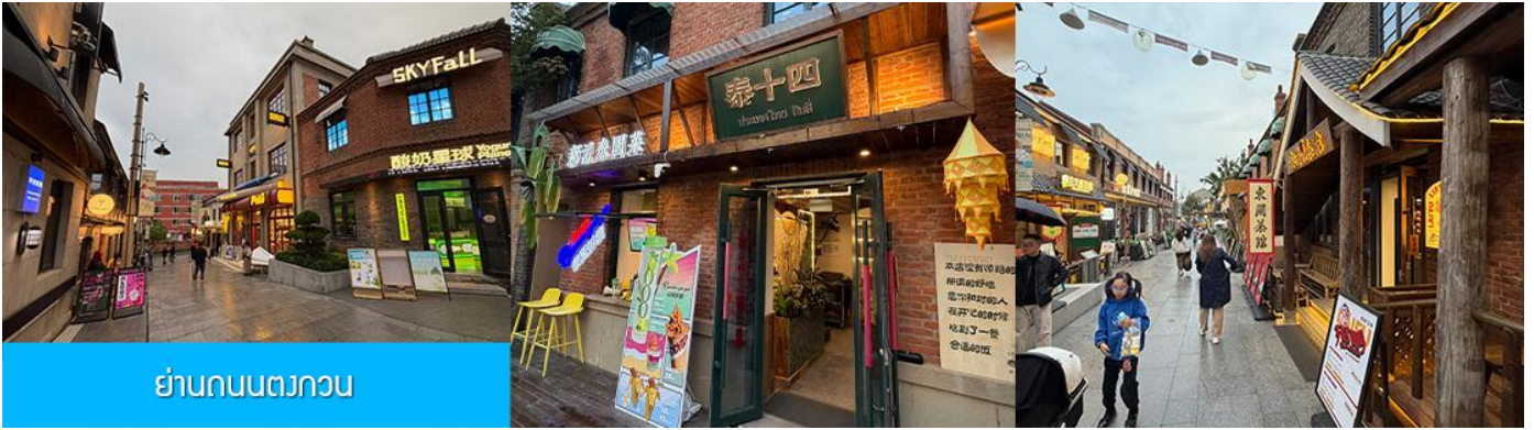
ย่านถนนตวงกวน