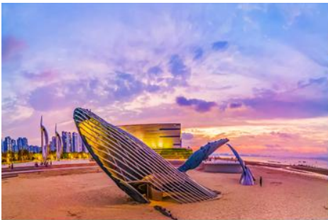
ประติมากรรม วาฬโดดเดี่ยว

จากนั้นนำท่านเดินทางสู่ เมืองเยินไถ 烟台 (ระยะทาง 85 กม. ใช้เวลาเดินทางราว 1 ชั่วโมงเศษ)