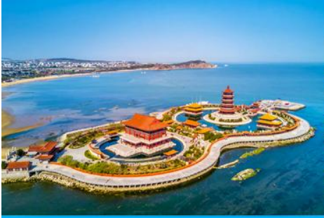
อุทยานทงเกี้ยวแปดเซียนข้ามทะเล