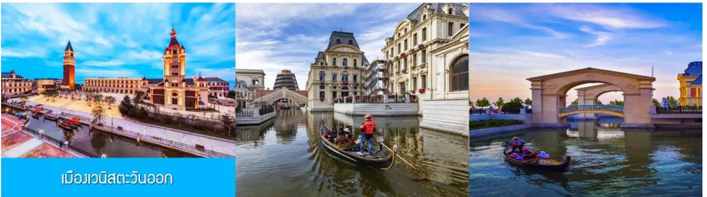
เมืองเวนิสตะวันออก

จากนั้นนำท่านเที่ยวชม เมืองเวนิสตะวันออก 大连东方威尼斯城 เป็นเมืองเวนิสจำลองที่ถูกสร้างขึ้นด้วยทุนกว่า 8,000 ล้านบาท ออกแบบโดยบริษัท ARC จากประเทศฝรั่งเศส โดยจำลองผังเมืองเวนิสในประเทศอิตาลี