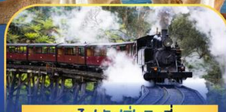
รถไฟพัพฟิงบิลลี่

ล่องเรือชมอ่าวซิดนีย์พร้อมรับประทานอาหารกลางวัน และ เข้าชมสวนสัตว์การองก้า