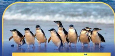
พาเหรดนกเพนกวิน