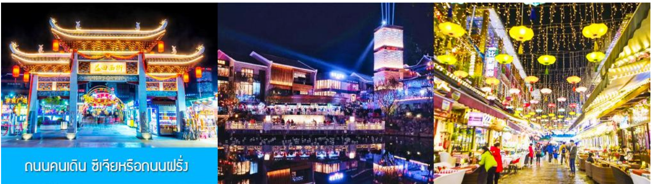
ถนนคนเดิน ซิเจียหรือถนนฝรั่ง