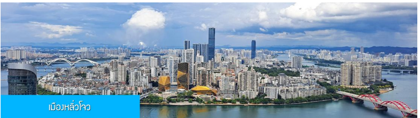
เมืองหลิวโจว

เช้า รับประทานอาหารเช้า ณ ห้องอาหารของโรงแรม (1)