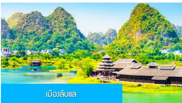
เมืองลับแล

พักที่ YANGSHUO ELITE GARDEN HOTEL ระดับ 4 ดาว ท้องถิ่นหรือเทียบเท่าใน เมืองหยางชว่