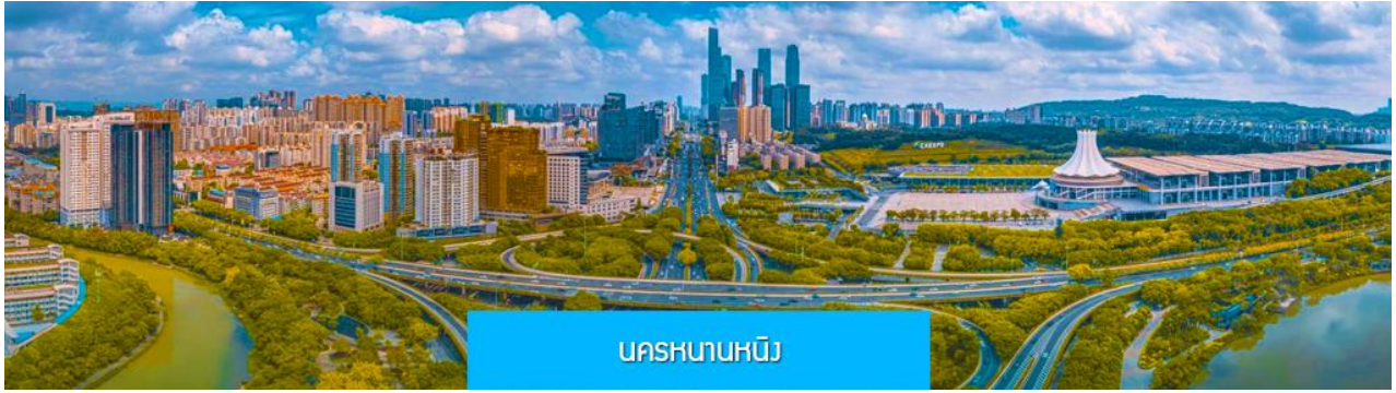
นครหนานหนิง