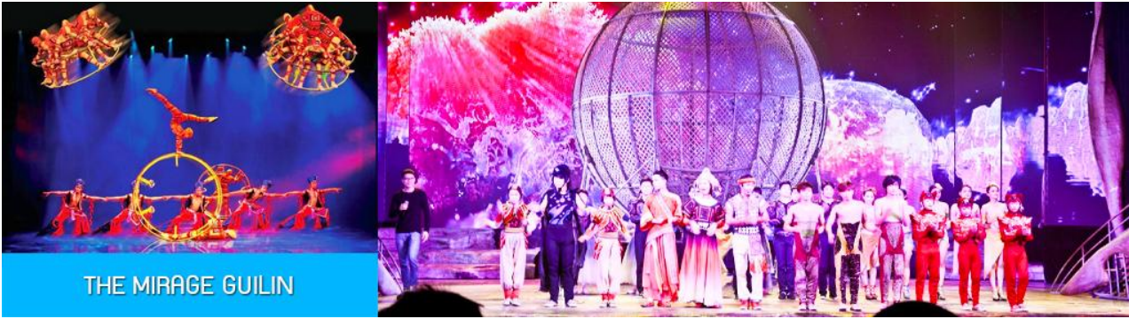
THE MIRAGE GUILIN