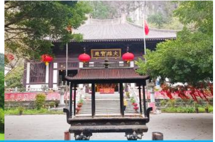
วัดซีเสี่ย