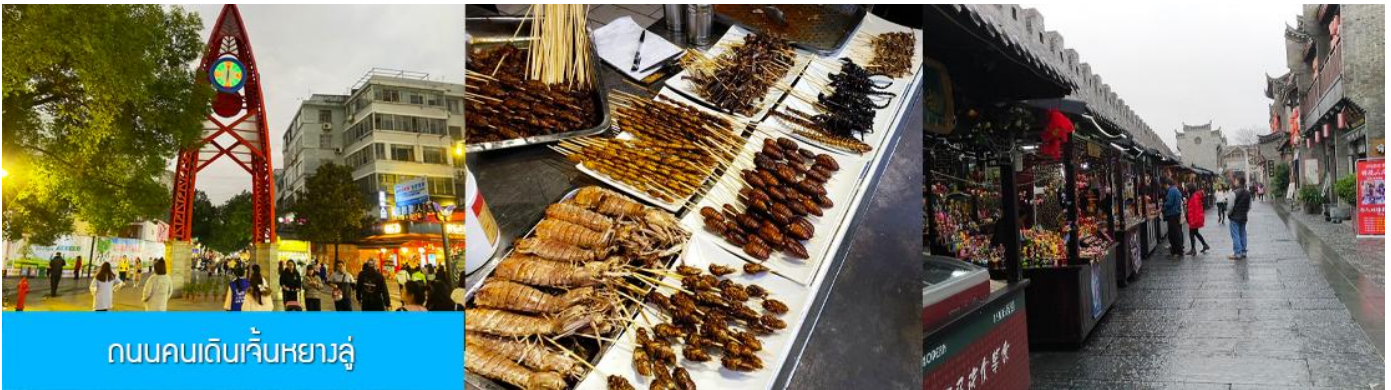
ถนนคนเดินเจิ้นหยางลู่