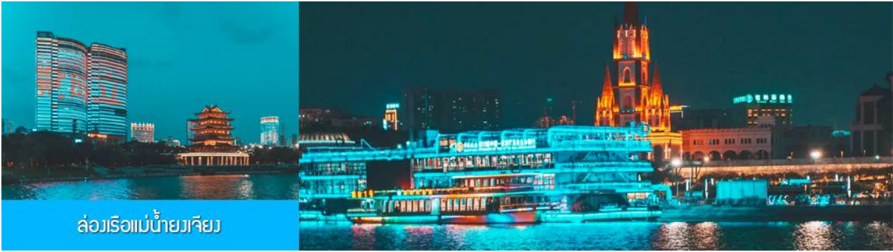
ล่องเรือแม่น้ำยวเจียง

ไกด์ท้องถิ่นนำเสนอ โปรแกรมทัวร์เสริม OPTIONAL TOUR ล่องเรือแม่น้ำยวเจียงชมแสงสียามค่ำของเมืองหนานหนิง..... อัตราค่าบริการสำหรับโปรแกรมเสริมเมืองลับแล ท่านละ 250 หยวน ใช้เวลาประมาณ 1 ชั่วโมงครึ่ง ค่าบริการรวม ค่าบัตรเข้าชม ค่ารถรับ ส่ง และค่าน้ำทิพย์ของไกด์ท้องถิ่น