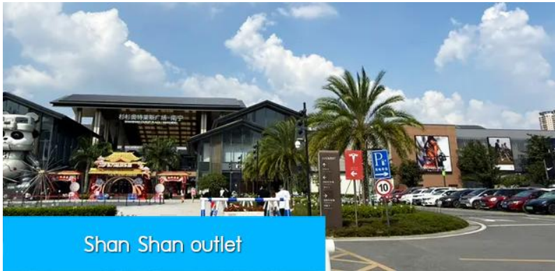
Shan Shan outlet

เช้า บริการอาหารเช้า ณ ร้านอาหารในโรงแรม (8)