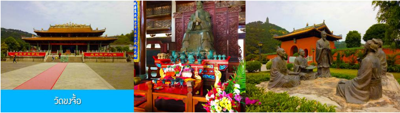
วัดขงจื้อ