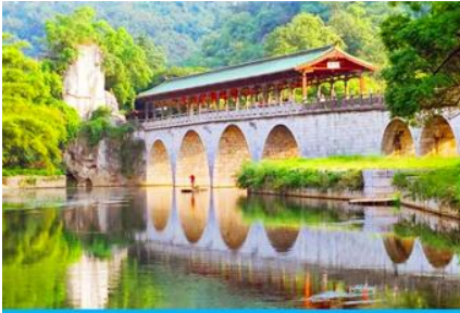
สวนเจ็ดดาว

หลังอาหารเช้าท่านเดินทางสู่ เมืองกุ้ยหลิน 桂林 เมืองท่องเที่ยวชื่อดังในมณฑลกวางสี