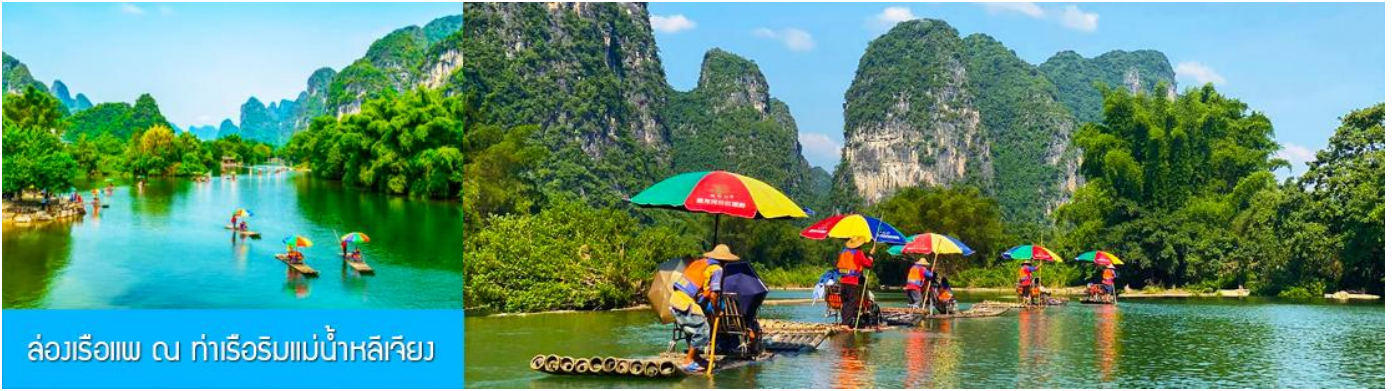
ล่องเรือแพ ณ ท่าเรือริมแม่น้ำหลีเจียง