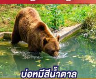
บ่อหมีสีน้ำตาล