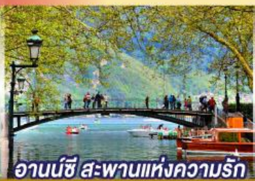
อานันชี สะพานแห่งความรัก