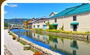
คลองไอตารุ