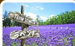
โทมิตะฟาร์ม