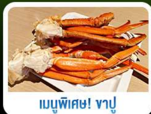
เมนูพิเศษ! ขาปู