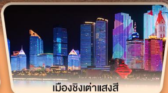
เมืองซิงต้าแสงสี