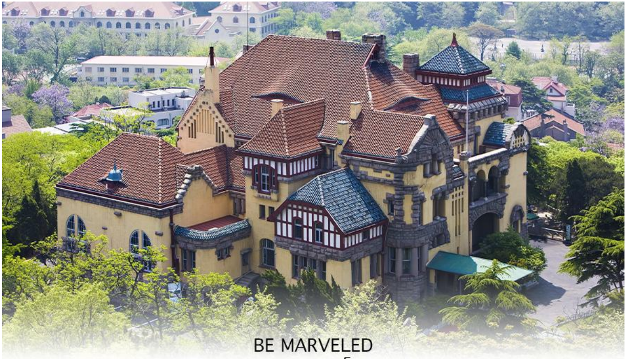
BE MARVELED พระตำหนักกรังโหลว