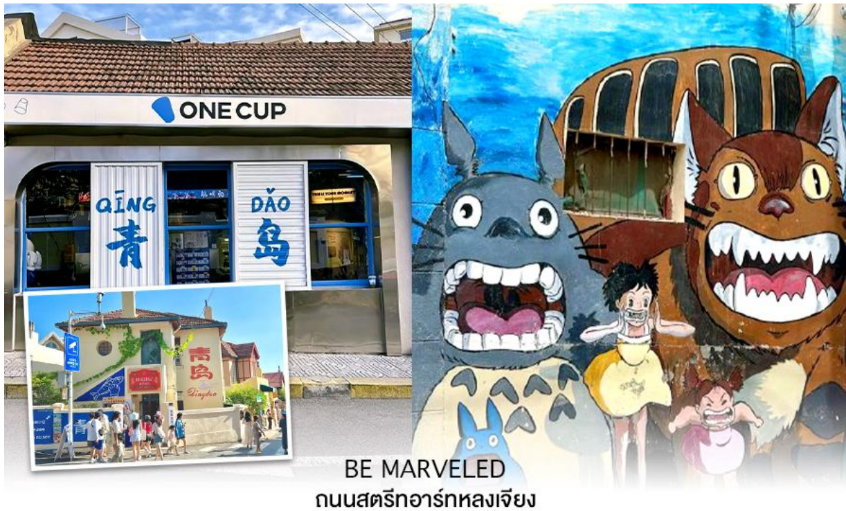
BE MARVELED ถนนสตรีอาร์ทหลงเจียง

จากนั้นนำท่านไปชม ทุ่งดอกฟิงค์มอส เป็นสวนดอกไม้ขนาดใหญ่ ในช่วงฤดูใบไม้ผลิทุ่งหญ้าจะปกคลุมไปด้วยดอกฟิงค์มอส ลักษณะของดอกฟิงค์มอสคล้ายดอกซากุระแต่บานบนพื้นดิน ออกดอกหนาแน่นสีชมพู ขาว และม่วง เป็นดอกไม้พุ่มเตี้ย ดอกขนาดเล็ก จะบานสะพรั่งเป็นพรมดอกไม้ เหมาะสำหรับการเดินเล่น ชมดอกไม้ ถ่ายรูป