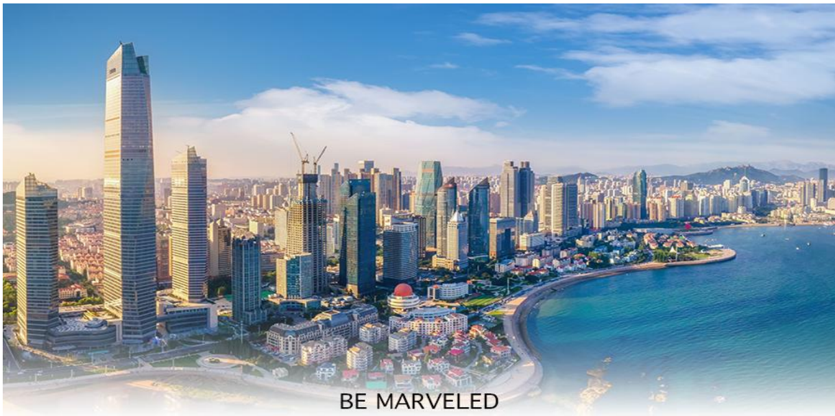
BE MARVELED เมืองชิงเต่า

02.25 น. ออกเดินทางสู่ สนามบินชิงเต่า โดยสายการบิน Shandong Airlines (SC) เที่ยวบินที่ SC4080 บริการ SNACK บนเครื่อง 07.58 น. เดินทางถึง สนามบินชิงเต่า เมืองชิงเต่าเป็นเมืองชายทะเลที่ตั้งอยู่ทางตอนใต้ของมณฑลซานตง ประเทศจีน มีชื่อเสียงจากบรรยากาศที่ผสมผสานระหว่างสถาปัตยกรรมสไตล์ยุโรปสมัยอาณานิคมกับความทันสมัยของจีนอย่างลงตัว เมืองนี้เป็นเมืองที่รู้จักในฐานะบ้านเกิดของเบียร์ชิงเต่า (Tsingtao Beer) ที่มีชื่อเสียงระดับโลก