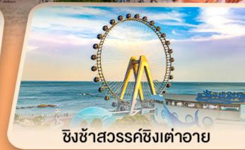
ชิงช้าสวรรค์ซิงต้าอาย