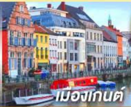
เมืองกันต์