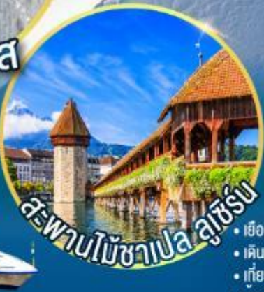
สะพานไม้ชาเปล ลูเซิร์น