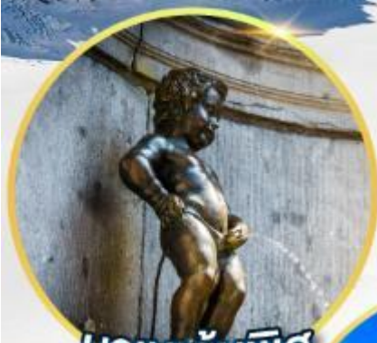
มานเนกันพิส