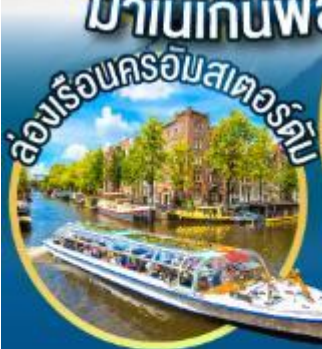
ล่องเรือนครอัมสเตอร์ดัม