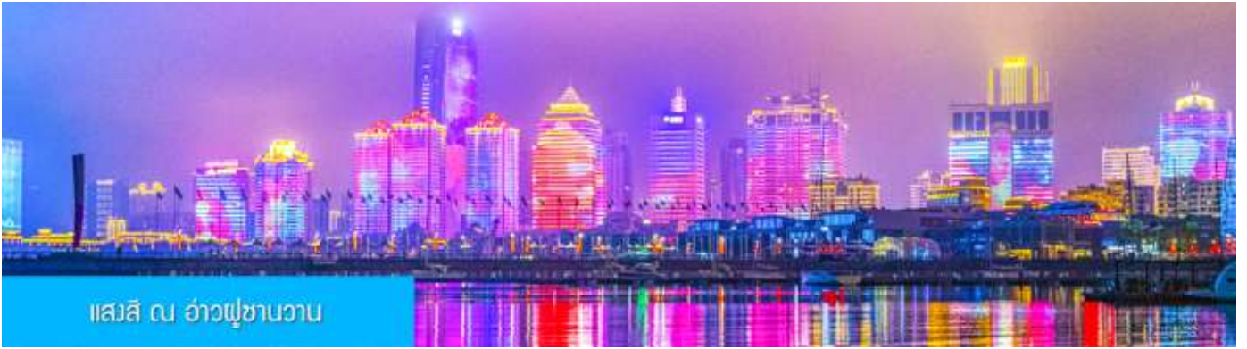
แสงสี ณ อ่าวฟูซานวาน