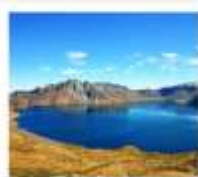
ฉางไป่ซาน