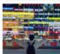
กำแพงมหาวิทยาลัยเหอหนิงเปิ่น