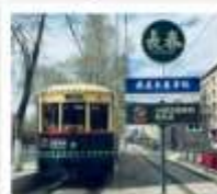
นั่งรถรางฉางชุน