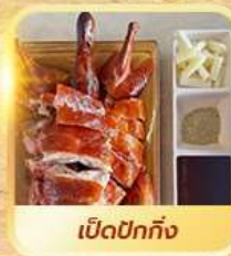
เปิดปอกทั้ง