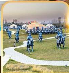
สวนเจงกิสข่าน