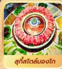
สุกีสไตล์มองโก