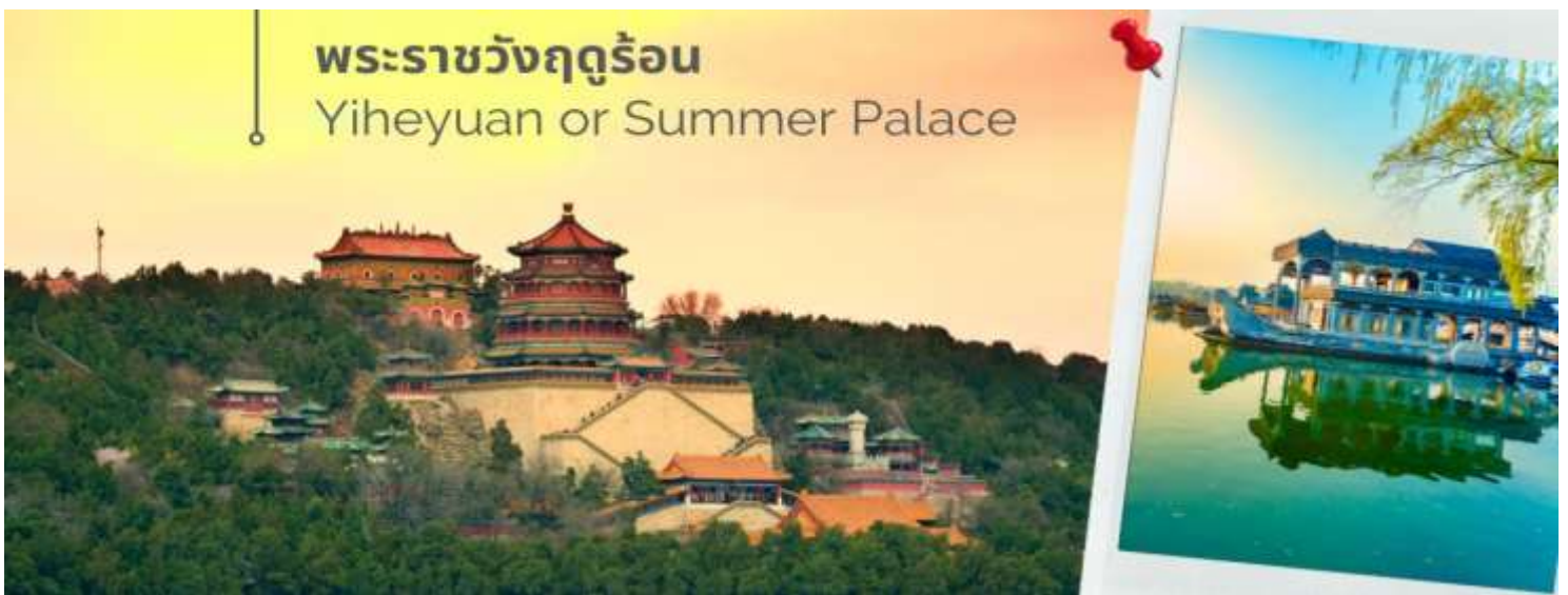
พระราชวังฤดูร้อน Yiheyuan or Summer Palace

วันที่สี่ พระราชวังฤดูร้อน - ร้านอาหาร - ร้านกาแฟร้านสวย - ถนนโบราณเฉียนเหมิน