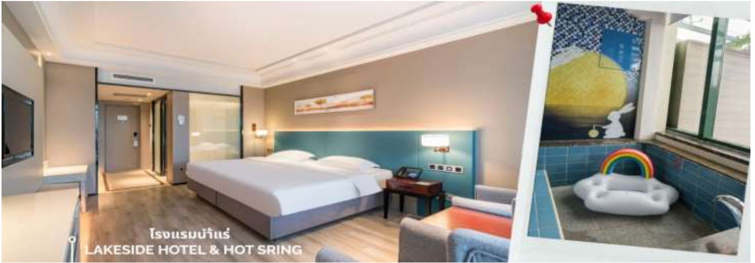
โรงแรมน้ำแร่ LAKESIDE HOTEL & HOT SPRING