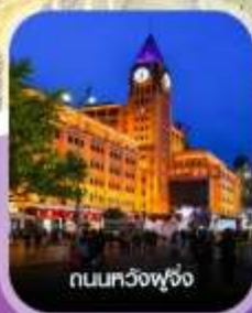
ถนนหวงฟู่จิ่ง

เช็กอิน กำแพงเมืองจีน สิ่งมหัศจรรย์แห่งแดนมังกร พระราชวังกู้กง วัดลามะ หอฟ้าเทียนถาน