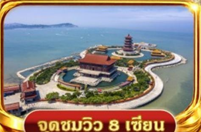
จุดชมวิว 8 เซียน