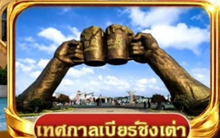
เทศกาลเบียร์ชิงเต่า