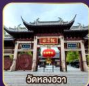
วัดหลงอวา