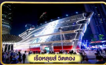
เรือหลุยส์ วัดตอง