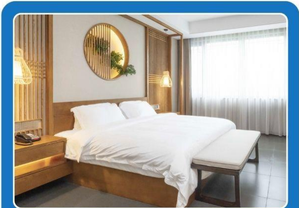
👤👤 DOUBLE (DBL)