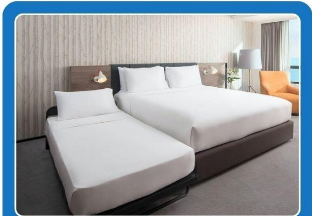
👤👤+👤 TRIPLE (TRP)

**รูปภาพห้องพักเป็นเพียงภาพสื่อถึงประเภทของเตียงเท่านั้น ไม่ใช่ภาพห้องพักจริงสำหรับการเข้าพัก**