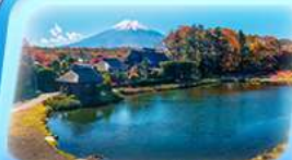
โอชิโนะอัทโท