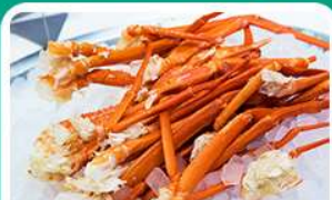
พิเศษ! บุฟเฟ่ต์ขาปู