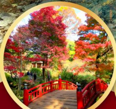
สวนดอกบ๊วยอาคางิ