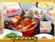
บูฟเฟต์ชาบู