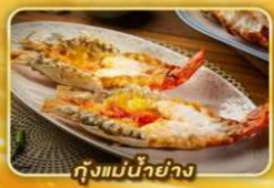
กุ้งแม่น้ำย่าง