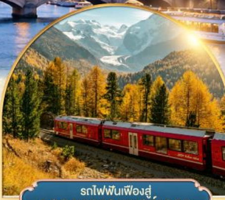
รถไฟฟันเฟืองสู่ ยอดเขากรอนเนอร์เกรต