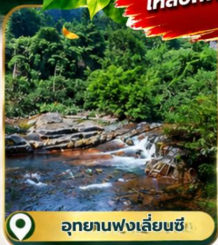
อุทยานฟ่งเลี่ยนซี