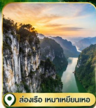
ล่องเรือ เหมาเหียนเหอ