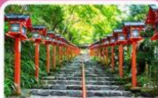
ศาลเจ้าคิฟูเนะ