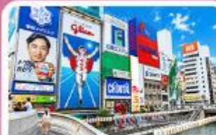
ชิบโซบาชิ