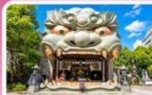
ศาลเจ้านิมมะ ยาชากะ