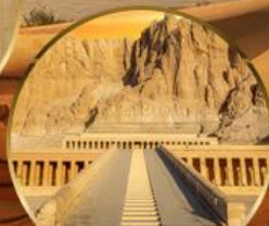
หุบเขากษัตริย์