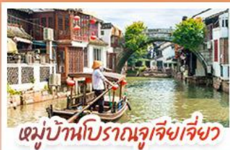
หมู่บ้านโบราณจูเจียงเจี๋ยว

สวนสนุกเซี่ยงไฮ้ดิสนีย์แลนด์ เต็มวัน (รวมรถรับ-ส่ง)