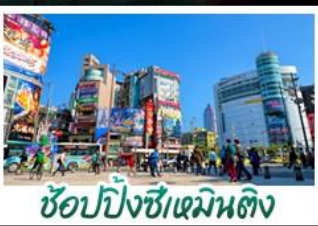
ซ้อปั้งซีเหมินติง